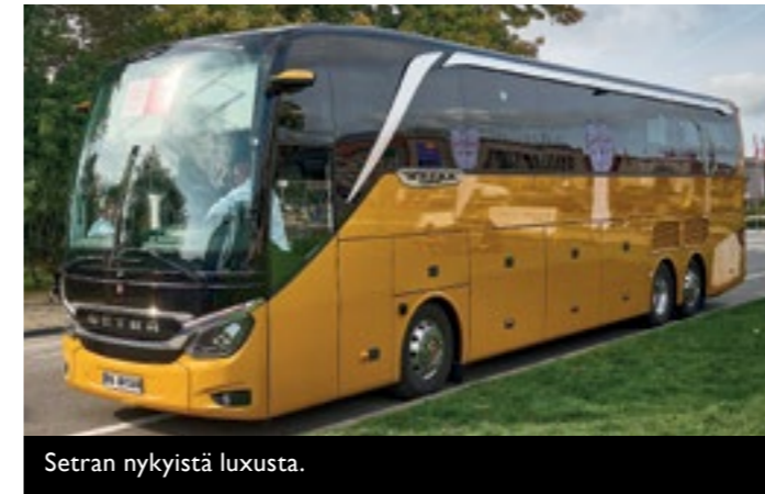
Setran nykyistä luxusta.

Kiinalaisten bussien osuus oli suuri. Heidän tuotteitaan oli esillä peräti kahden näyttelyhallin verran.