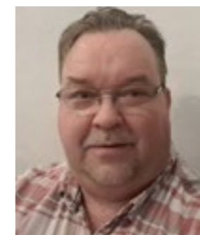
KLUBITUOTTEET Jukka Järvinen clubituote@ tilausajokuljettajat.fi