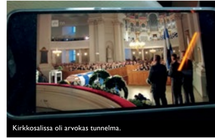
Kirkkosalissa oli arvokas tunnelma.