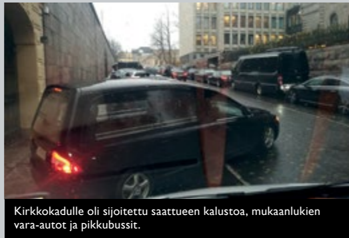
Kirkkokadulle oli sijoitettu saattueen kalustoa, mukaanlukien vara-autot ja pikkubussit.