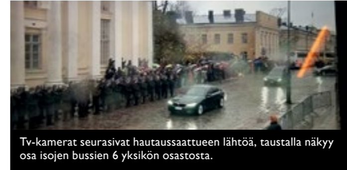
Tv-kamerat seurasivat hautausaattueen lähtöä, taustalla näkyy osa isojen bussien 6 yksikön osastosta.

Television kautta saatoimme myös valmistautua siunaustilaisuuden jälkeen tuleviin asioihin ja toimintoihin saattoväen kuljettamisissa haluttuihin paikkoihin keskustassa mm Kaupungintalolle. Valtion juhlahuoneisto Smolna oli varattu muistotilaisuuteen. Sen edusta oli sangen kiireinen, kun hautausmaalta ja muualta tulevat osallistujat saapuivat samoihin aikoihin eteläiselle Esplanadille. Hyvin liikenteen ohjaus siitakin selvisi.