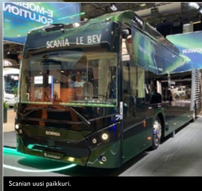
Scanian uusi paikakuri.

Meidän markkina-alueen isoimmat ja tärkeimmät merkit olivat tottakai paikalla. Vain yksi joukosta puuttui eli Volvo. Uutuuksina voidaan pitää Vanhoolin T-sarjan esittely monine versioineen ja Setran uusi bussimallisto. Tämän lehden lukijoille ne on esitelty aiemmissa numeroissa, mutta nyt suuri yleisö pääsi niitä ihastelemaan. Scania osastolla vetonaulana oli espanjalaisen korittajan Castroson kanssa tehty uusi paikallisbussi.