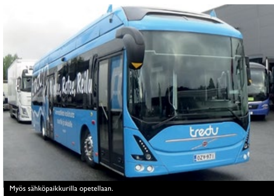
Myös sähköpaikurilla opetellaan.

T ampereen seudun ammattiopisto eli Tredu järjesti kokonaisvaltaisen logistiikkaan keskittyvän päivän Hervannan toimipistellään elokuun lopussa.