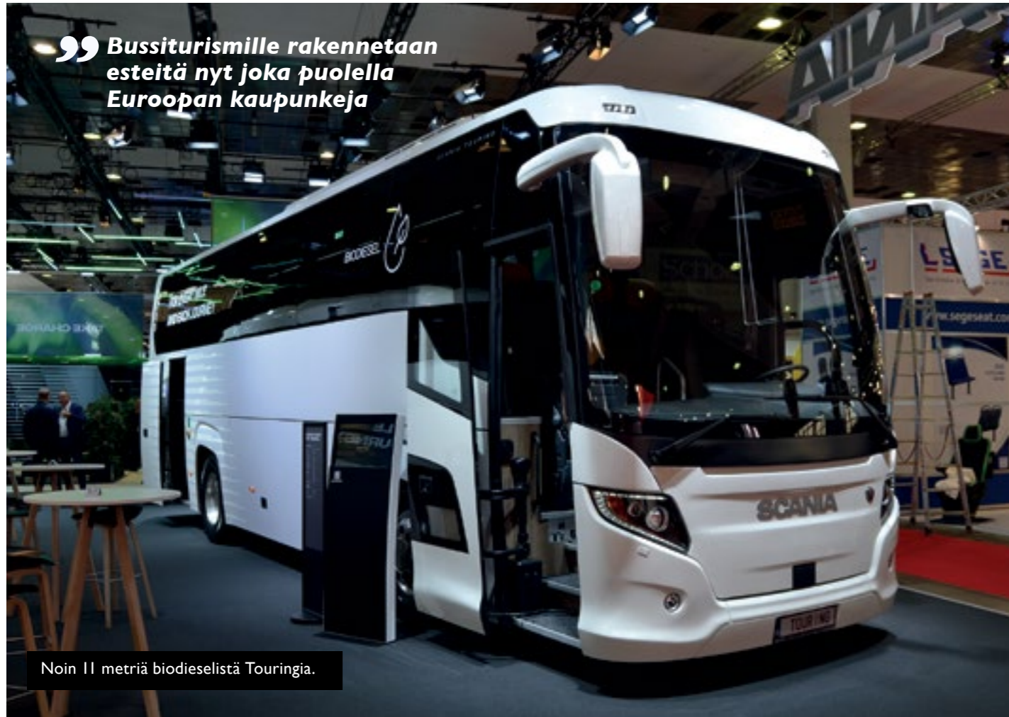
Noin 11 metriä biodieselistä Touringia.

” Bussiturismille rakennetaan esteitä nyt joka puolella Euroopan kaupunkeja