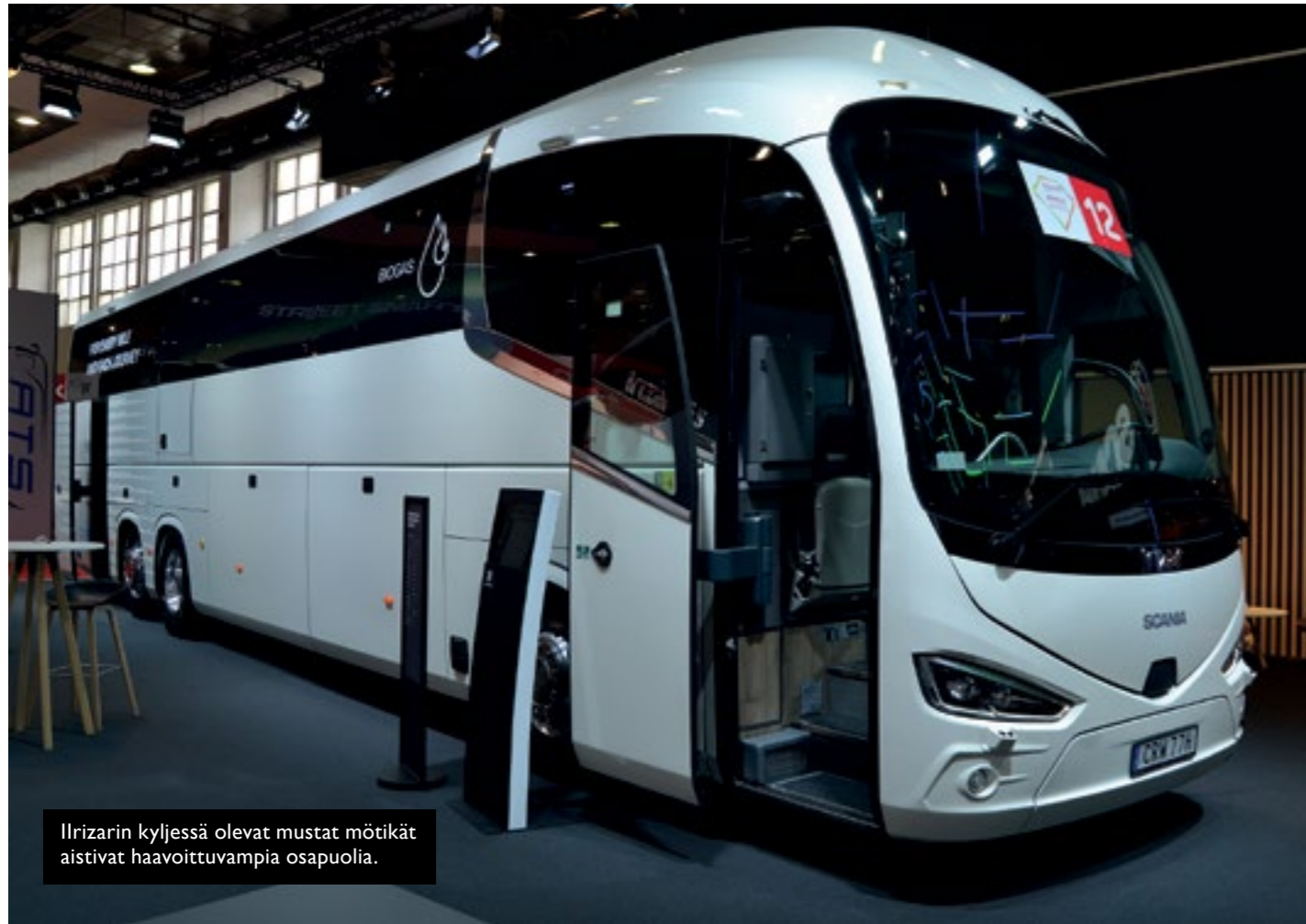
Ilirizarin kyljessä olevat mustat mötikät aistivat haavoittuvampia osapuolia.