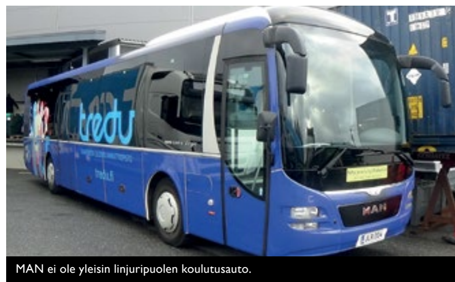
MAN ei ole yleisin linjuripuolen koulutusauto.