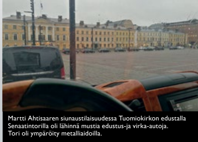
Martti Ahtisaaren siunaustilaisuudessa Tuomiokirkon edustalla Senaatintorilla oli lähinnä mustia edustus- ja virka-autoja. Tori oli ympäröity metalliaidoilla.

Saatettuamme vieraat Tuomiokirkkoon jäimme odottelemaan tilaisuuden alkua ja oli hienoa seurata matkapuhelimen kautta tilaisuuden etenemistä. Ylen suora lähetys tapahtumista oli mielenkiintoista katsottavaa niin kuvan kuin äänenkin osalta.