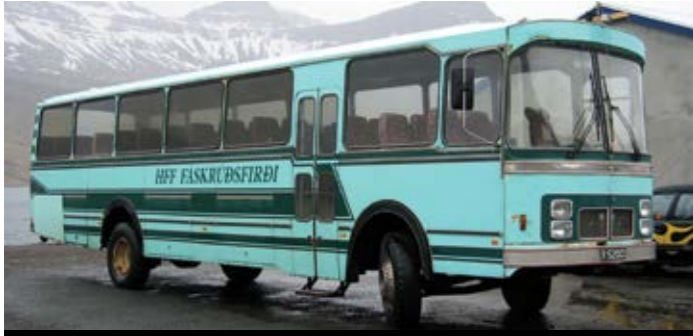
Fäskrudsfjörðurissa Islannin itäosassa vuonon rannalla oli kyseinen bussi pysäköitynä laiturilla. Bussi on Mercedes-Benz, vaikkei merkkiä näy keulassa, korin valmistaja jäi tuntemattomaksi. Huomio kiinnittyi 2-akselisuuteen, jolla on tarkoitus saada pitoa jyrkillä sorateilla tai talvikelille.