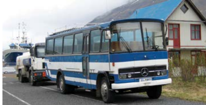
Tämä oli ensimmäinen islantilaisbusi, jonka näin ajettuani ulos Seydisfjörðurissa M/S Norrönalta, Mercedes-Benz LP 1970-luvulta.