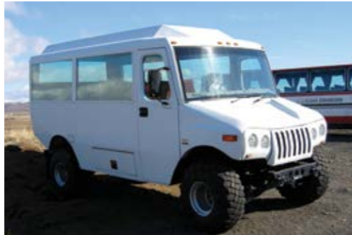
Uusi koulubussi pohjoisrannikolla Husavikissä: Norjasta tuotu Hummer Berserk.