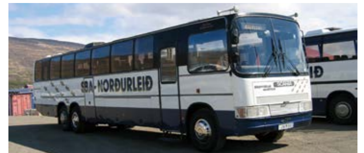
Mercedes-Benz oli bussien valtamerkki, myös Scaniaa löytyi. Useimmat pitkät bussit olivat suomalaisia Delta/Kutter-korisia. SBA Akureyrissä omisti tämän upean pitkän ja korotetun Delta Expressin.