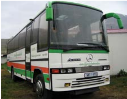
Uudempaa Mercedes-Benz Actros tuotantoa Jonckheeren korilla, korotettu Euro 3. Tämä pienehkö busi kulki itärannikon vuonoilla.