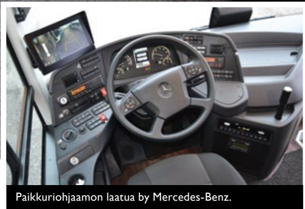
Paikkuriohjaamon laatua by Mercedes-Benz.

Loppuvuonna 2022 taloon tuli peräti seitsemän uutta busia. Kilpailutuksen kautta tehdyn hankinnan voitti Daimler. Taloon tuli Setraa ja Mersua. Viimeisin saapui aivan hiljattain, eli Mercedeksen eCitaro, sähköinen paikkuribussi.