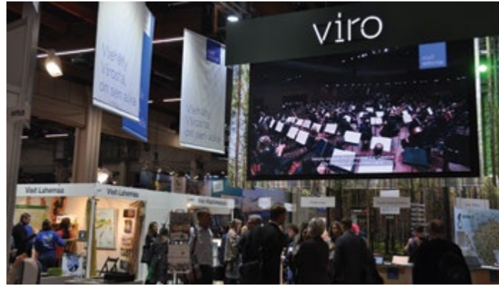
Matkamessujen partnerimaa oli tällä kertaa Kreikka.

Yhteisosastoille oli kerätty samalla suunnalla olevia kohteita niin koti- kuin ulkomaisten suunnista. Se on hyvä asia matkasuunnittelijoille. Virosta oli useita kohteita esillä näyttävän mainostason alla.