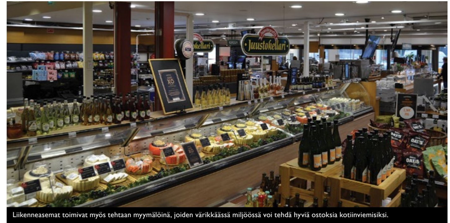
Liikenneasemat toimivat myös tehtaan myymälöinä, joiden värikkäässä miljöössä voi tehdä hyviä ostoksia kotiviemisiksi.

- Tilausajokuljettajien vuoden taukopaikka-tittelin valinta tuntuu erityisen hyvältä, kun tunnustus koskettaa koko Juustoportti-liikenneasemaketjun henkilöstöä. Taukopaikatittelin valinnan tehneet tilausajokuljettajat ja heidän asiakkaansa ovat suuri ja erittäin tärkeä asiakaskohderyhmä kaikille tienvarsipalveluita tarjoaville yrityksille. Kisa toimialalla on myös koronan jälkimainingeissa ollut kova. Kun