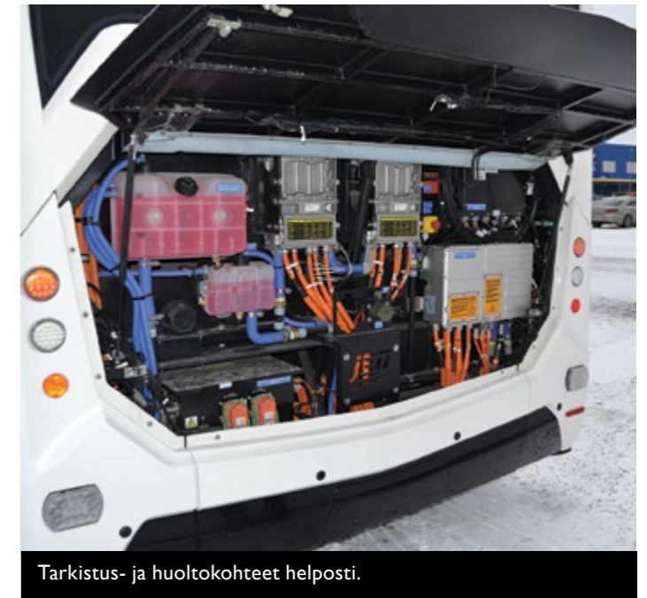
Tarkistus- ja huoltokohteet helposti.

Nyt on hyvä paketti. Miellyn tietysti suomalaisuuteen, mutta nyt on oikeasti mietitty asioita niin kuljettajan,