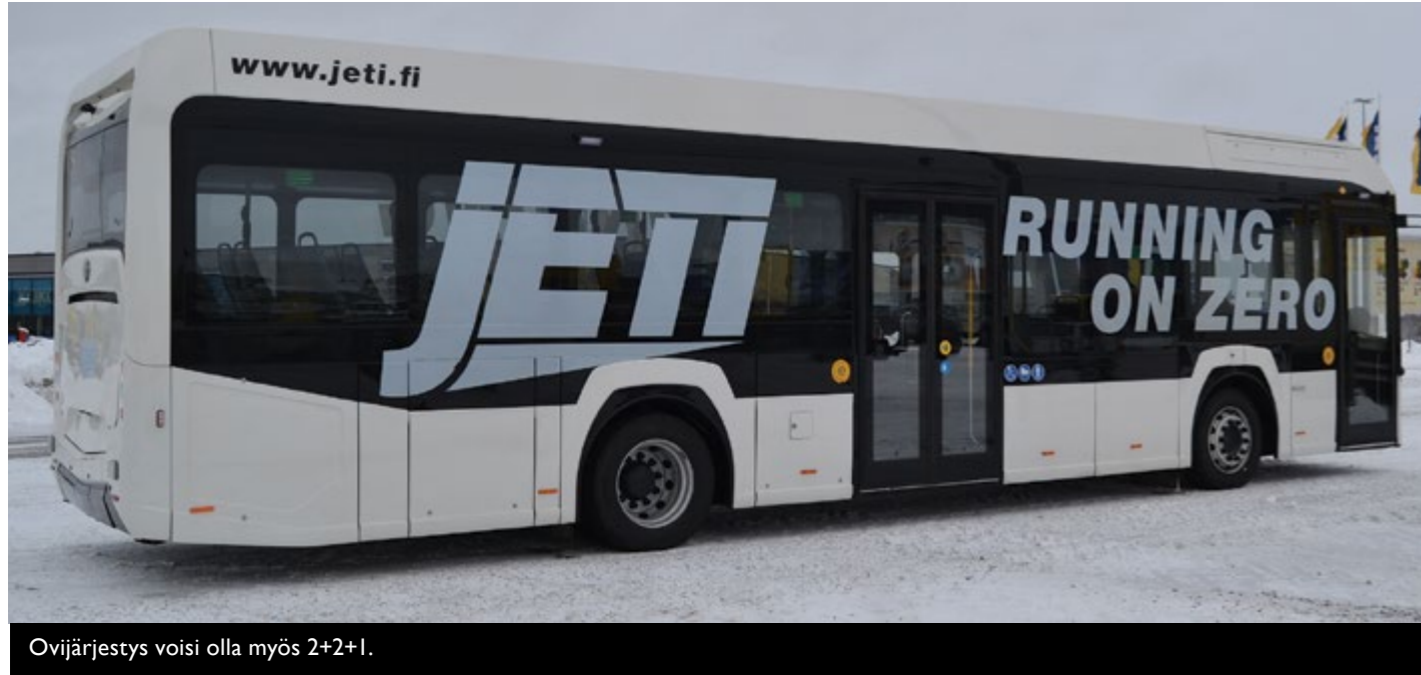
Ovijärjestys voisi olla myös 2+2+1.