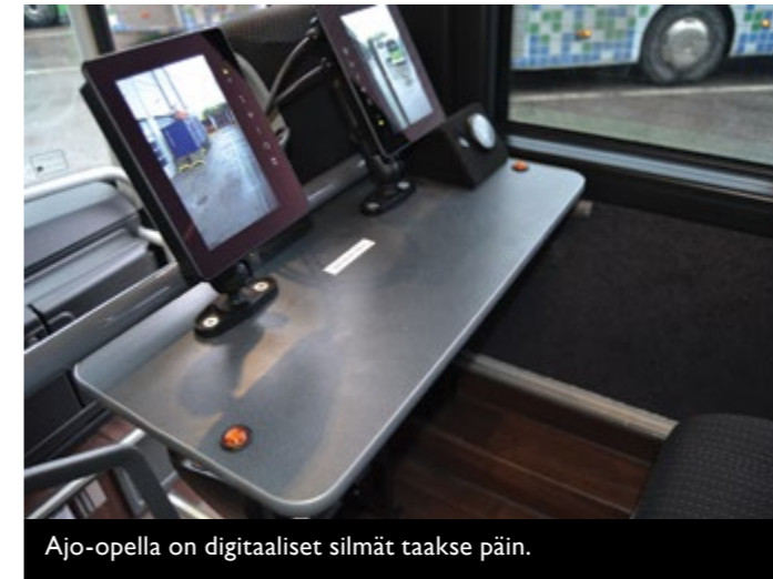
Ajo-opella on digitaaliset silmät taakse päin.

Alan uusi alku näkyi viime vuonna myös TTS:llä. Nyt koulutustarve uusille bussiosaajille on todella kova. Kysyntä ikäänkuin räjähti kun esimerkiksi tilausajomarkkinat elpyivät todella nopeasti viime keväänä ja kesänä. Paikallisliikenteen